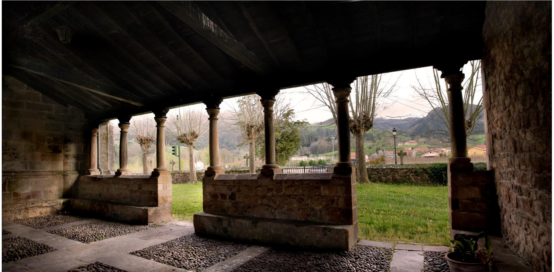
10 - MAZCUERRAS