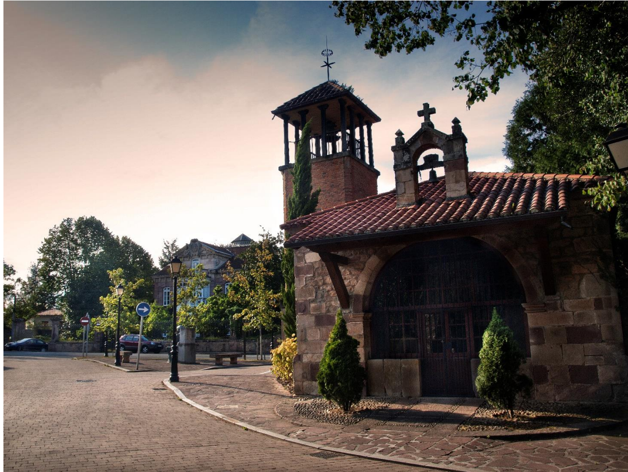
16 - MAZCUERRAS