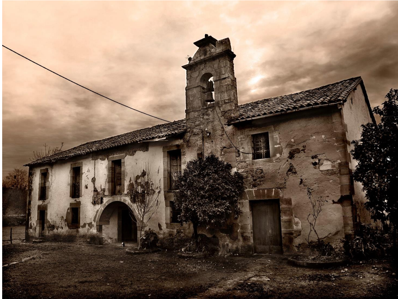
11 – MAZCUERRAS