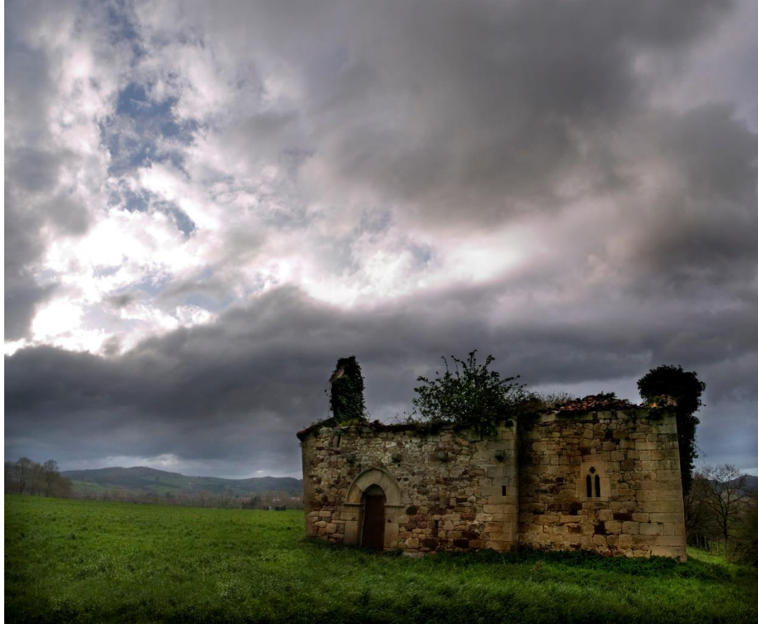
13 - MAZCUERRAS