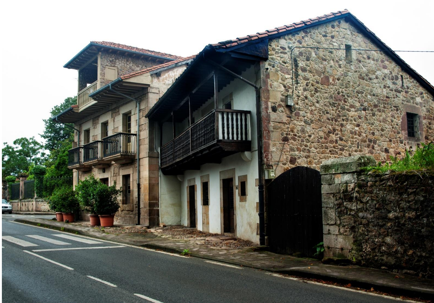
15 – MAZCUERRAS