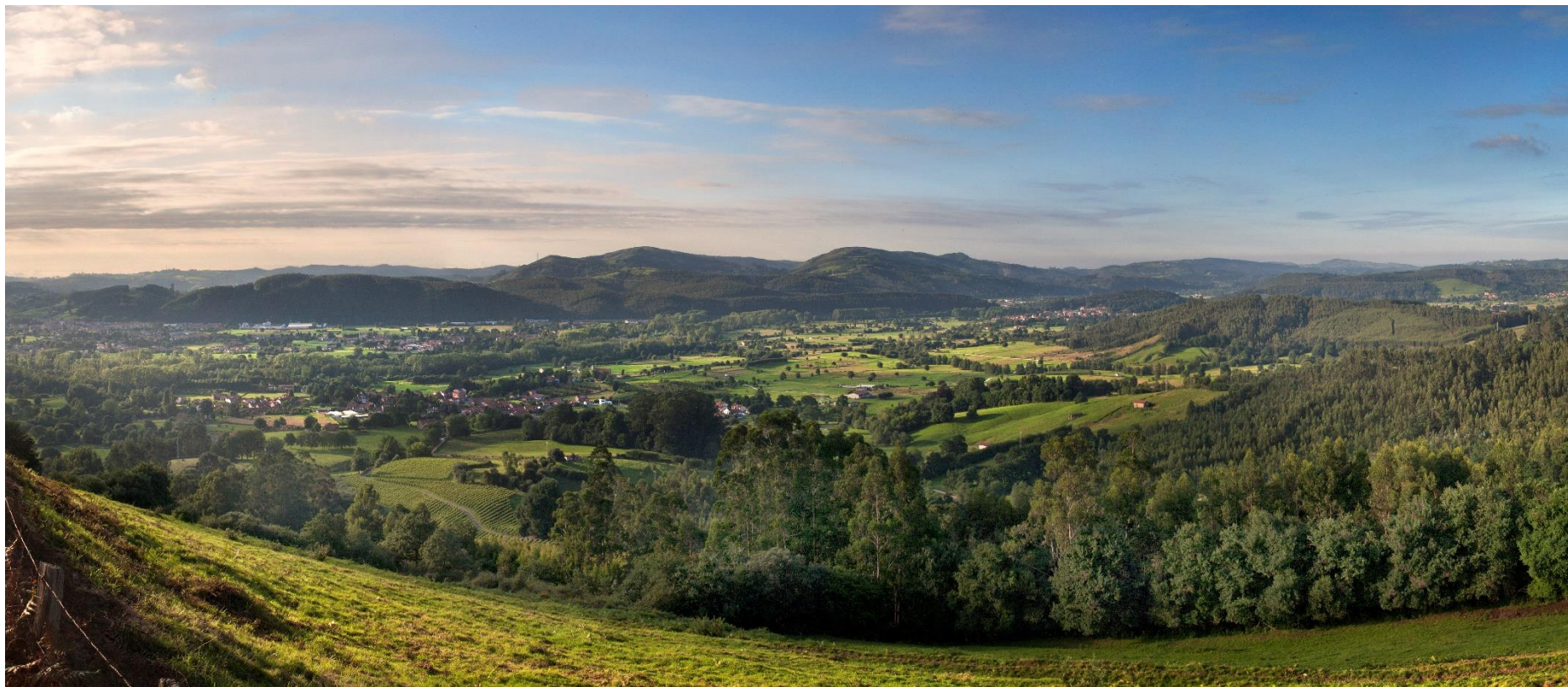
19 - MAZCUERRAS