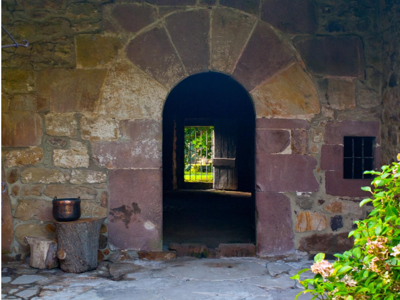
17 - MAZCUERRAS