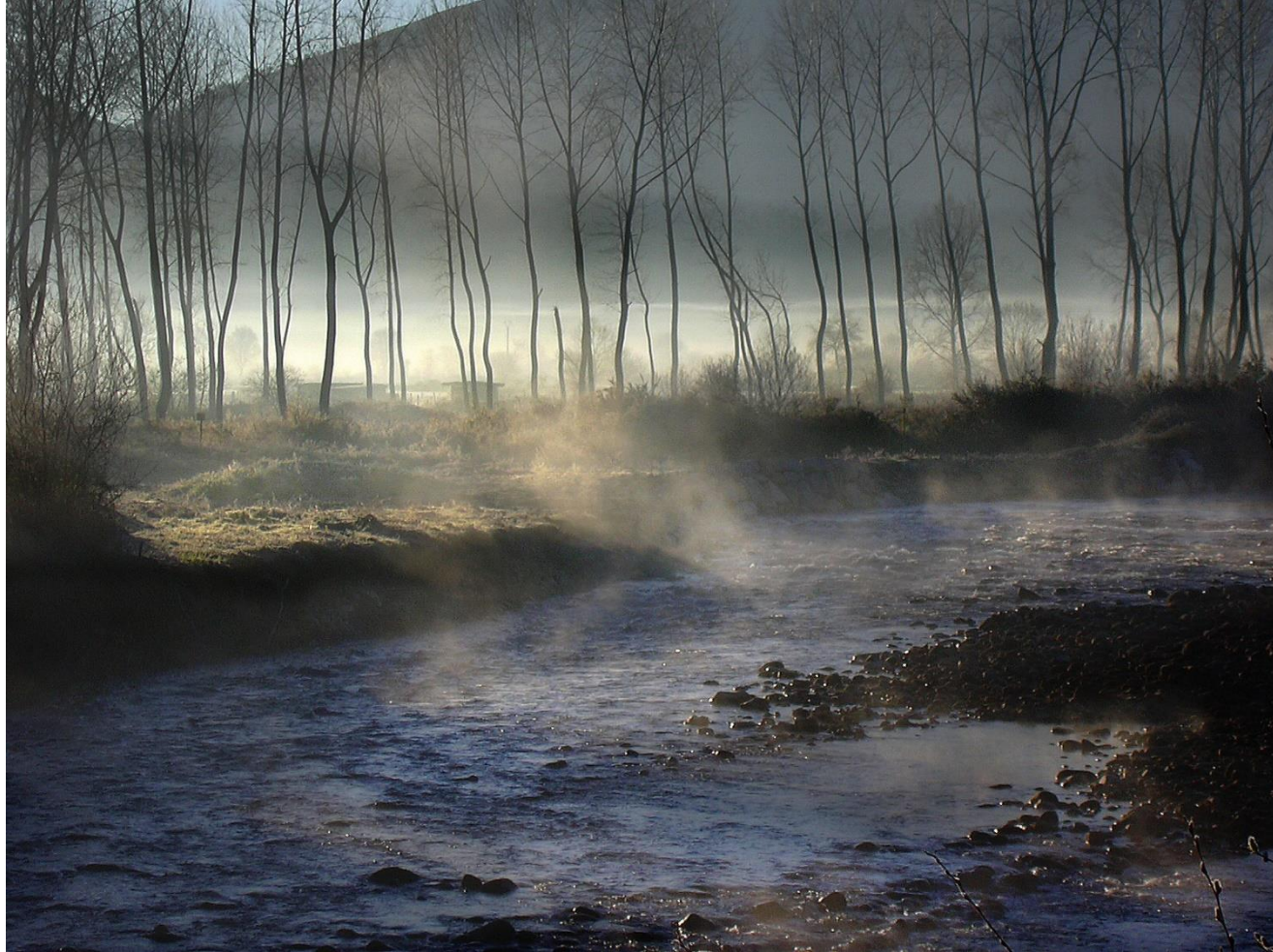
5 - MAZCUERRAS