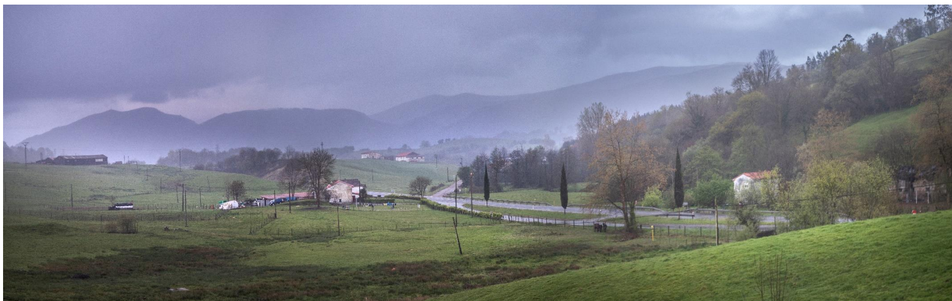
21 – CABEZÓN DE LA SAL