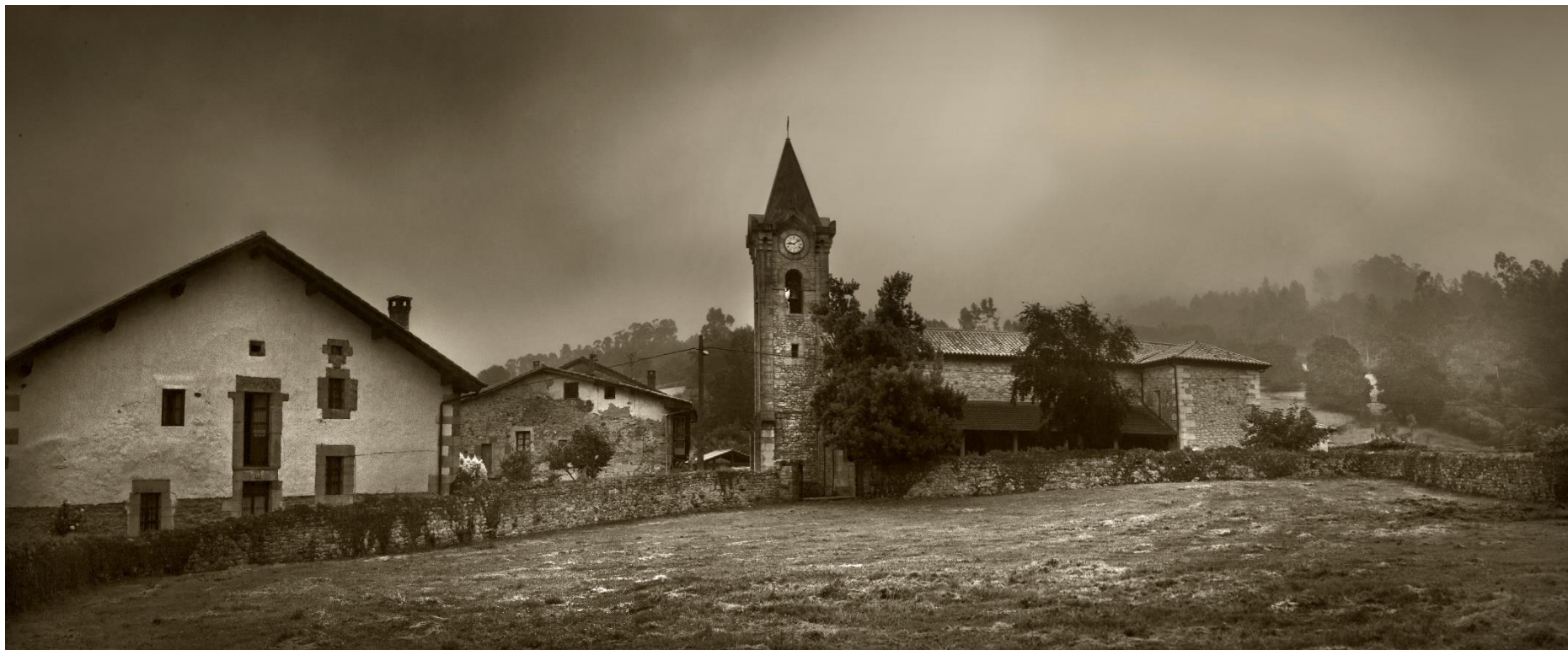
18 - MAZCUERRAS