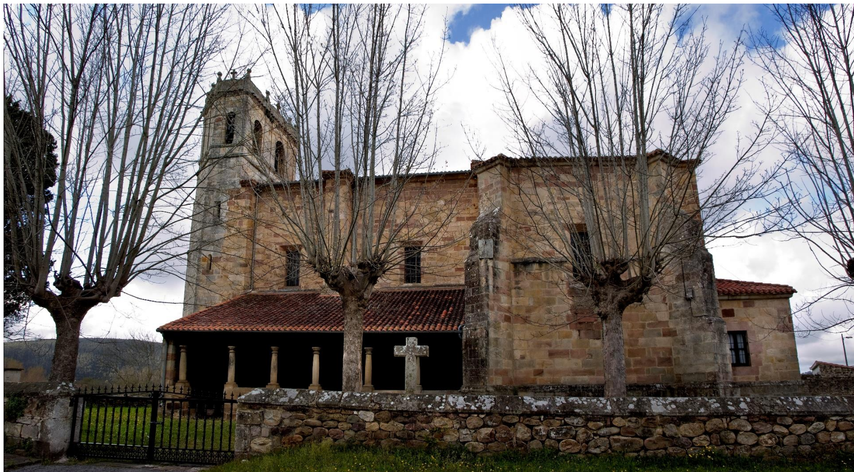
12 – MAZCUERRAS