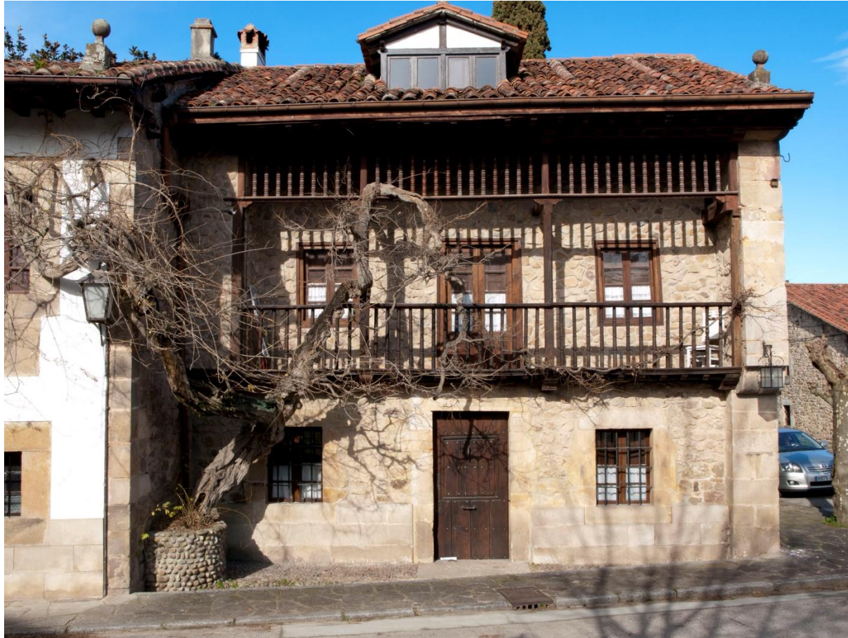
20 - MAZCUERRAS