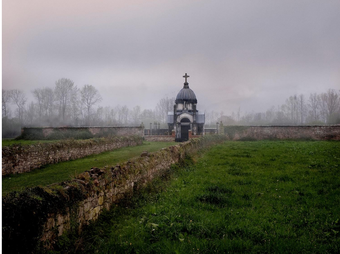
6 - MAZCUERRAS