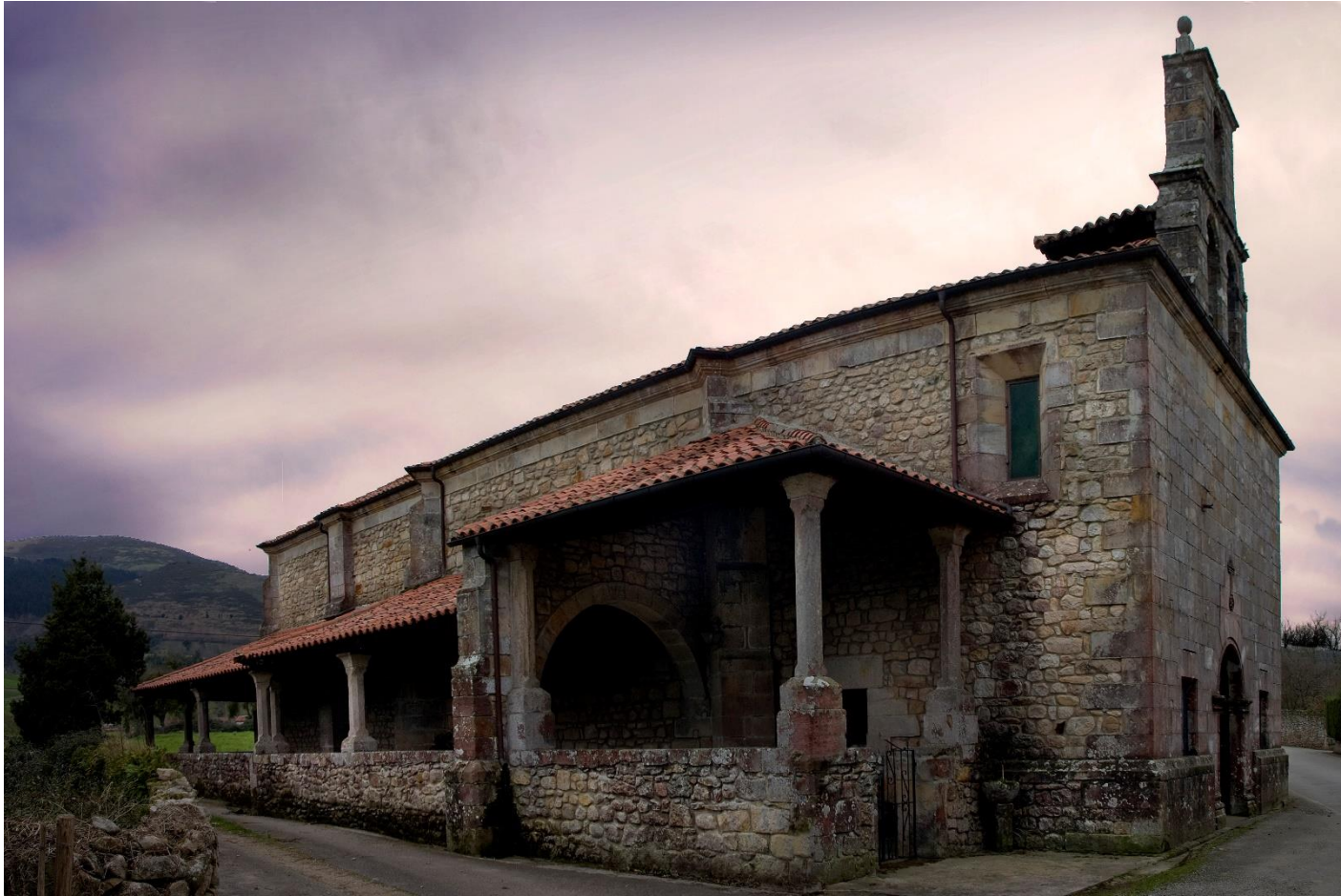
14 - MAZCUERRAS