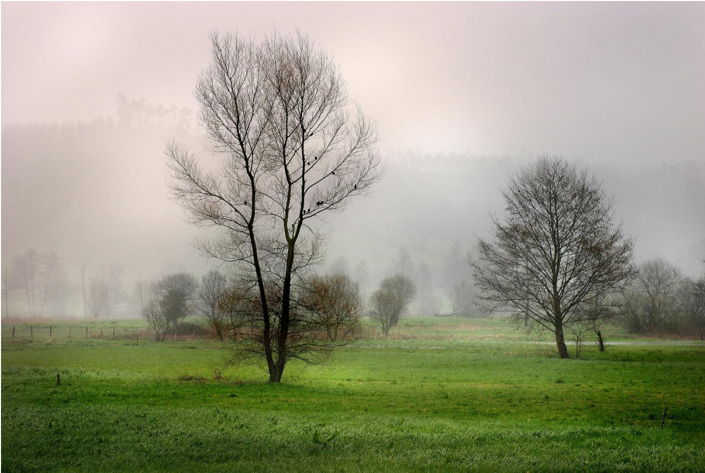
2 - MAZCUERRAS