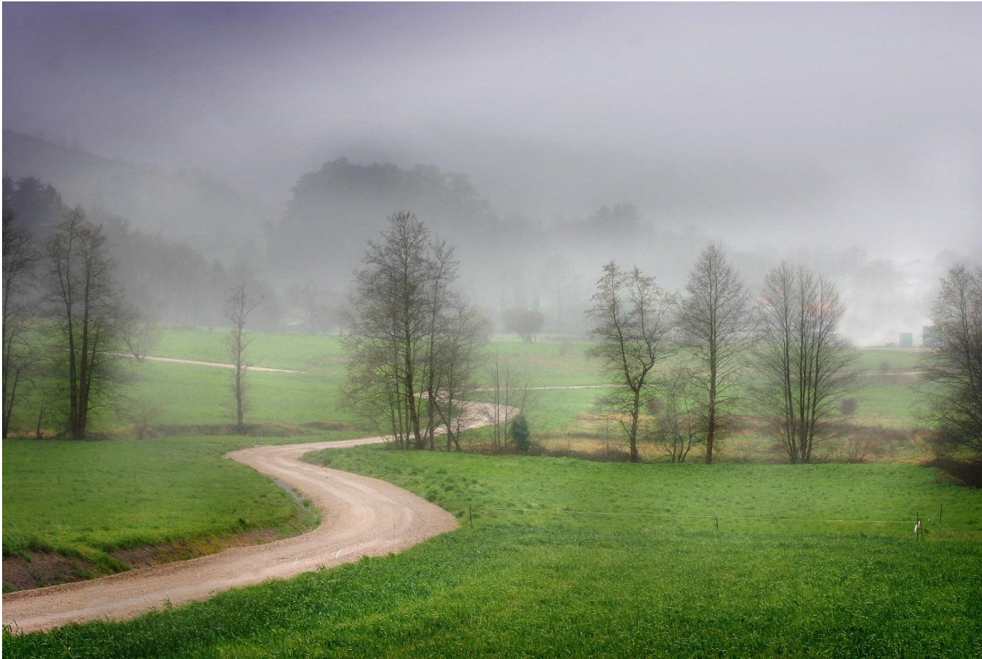
1 - MAZCUERRAS